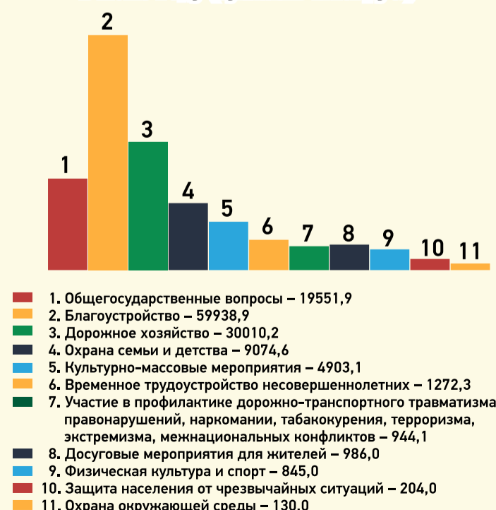
Структура расходов бюджета МО Горелово в 2018 году (сумма в тыс. руб.)

Местный бюджет МО Горелово на 2018 год объем доходов – 122 694,4 тыс. руб. объем расходов – 130 015,7 тыс. руб. дефицит бюджета – 7 321,3 тыс. руб.