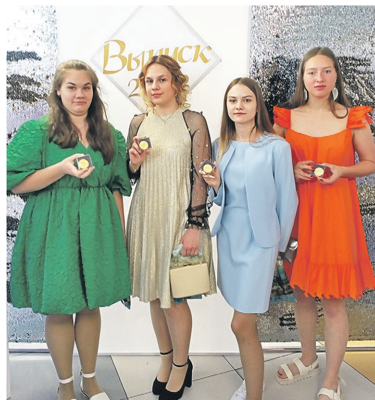
Наши лучшие выпускницы на районном празднике медалистов «Под алым парусом мечты»

Поздравляем девушек с заслуженными наградами, и всех выпускников с окончанием школы. Желаем высоких стремлений и побед!