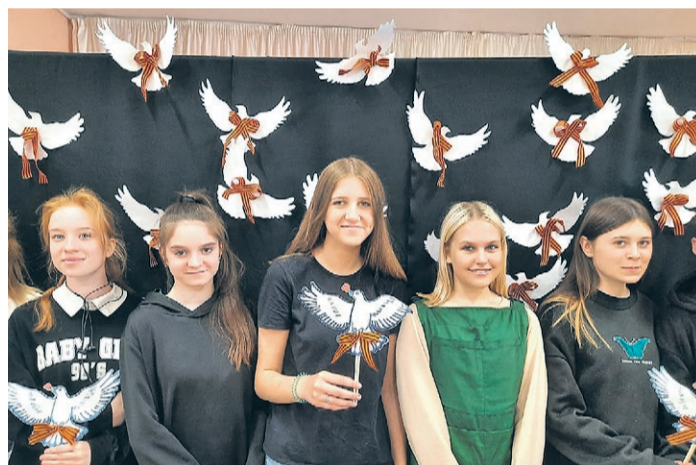
Трудовой отряд МО Горелово принял участие в мероприятии, приуроченном ко Дню памяти и скорби

Учащиеся принимаются на работу временно, в качестве рабочих по комплексному обслуживанию, и выполняют работу по благоустройству территории: убирают мусор на заброшенных территориях, ухаживают за зелеными насаждениями, занимаются прополкой, поливом зеленых насаждений, ухаживают за клумбами. За свой труд ребята получают материальное вознаграждение, а многие – и свою первую зарплату. Выполняя полезные дела для своего округа, работая в команде, ребята ощущают себя востребованными и нужными, и это очень важно для воспитания подростков.