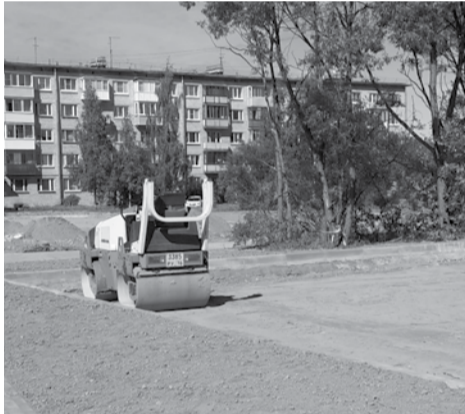
У дома № 20 по ул. Политрука Пасечника строят хоккейную площадку

Лето – сама горячая пора по приведению в порядок территории нашего муниципального образования.