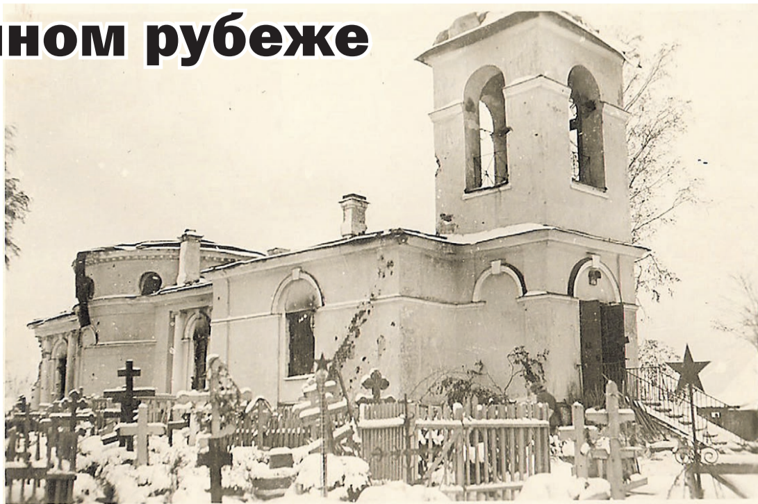
Церковь Адриана и Наталии в Старо-Паново. Фото 1941 года с аукциона e-bay.de

Военный совет фронта приказал 5-й дивизии народного ополчения занять тыловую укрепленную позицию на участке Константиновка – Пулково в составе 42-й армии. Но все же 13 сентября Гореловский