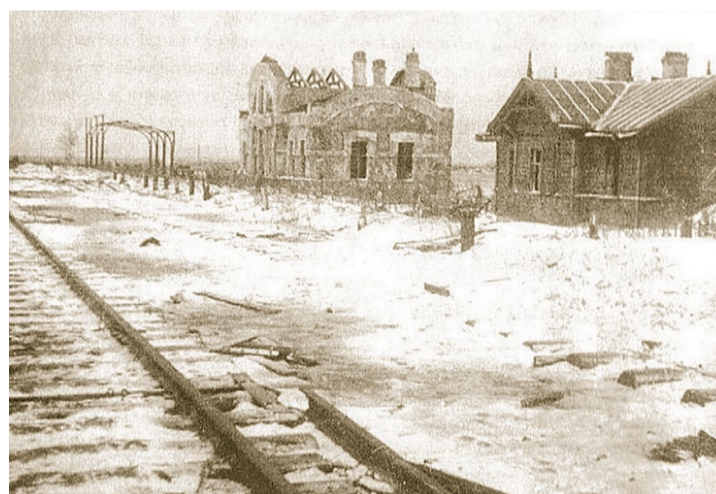
Вокзал в Горелово. Фото 1941 года с аукциона e-bay.de

15 сентября. Этот день на Урицком рубеже был критическим. С утра четыре вражеские