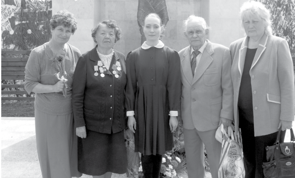
У мемориала детям – жертвам блокады в пос. Шатки Нижегородской обл., май 2010 г.