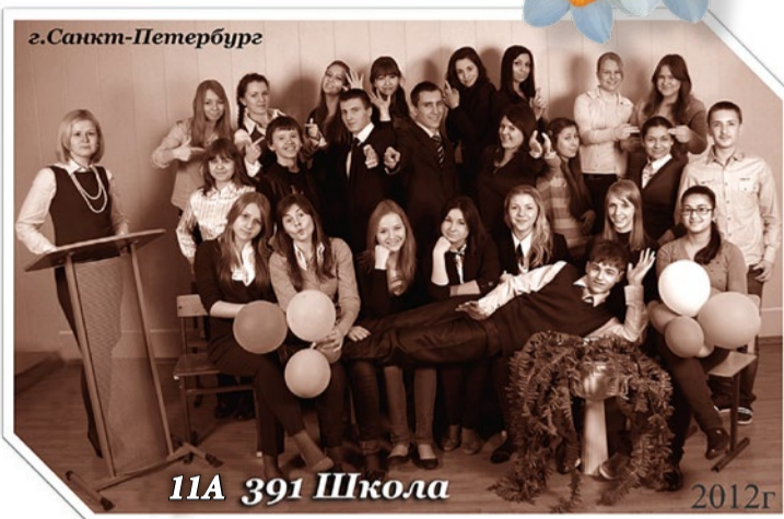
11А 391 Школа