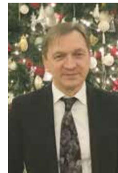
Дорогие жители, дорогие друзья!

Евгений НИКОЛЬСКИЙ, депутат Законодательного Собрания Санкт-Петербурга