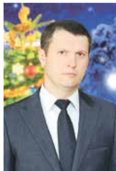
Уважаемые жители Красносельского района!

Примите самые теплые и искренние поздравления с наступающим Новым 2017 годом и светлым праздником Рождества Христова!